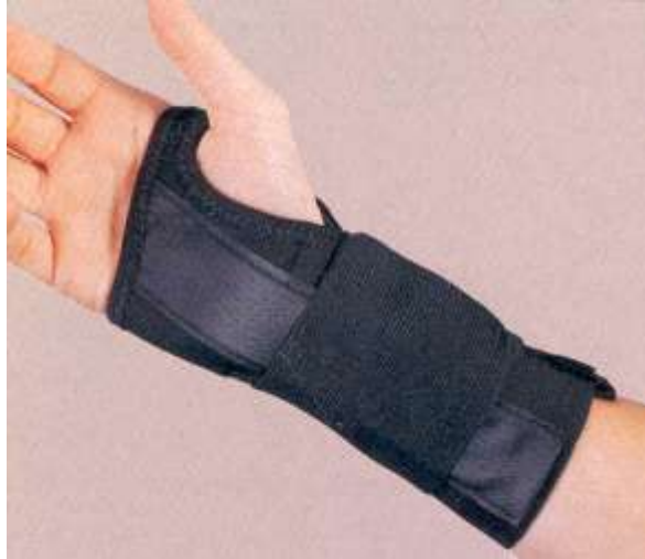
مچ بند (اسپلینت) برای سندرم تونل کارپ